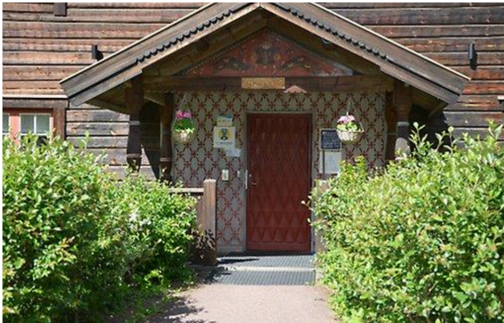
Rättviksgården Vandrarhem entré.