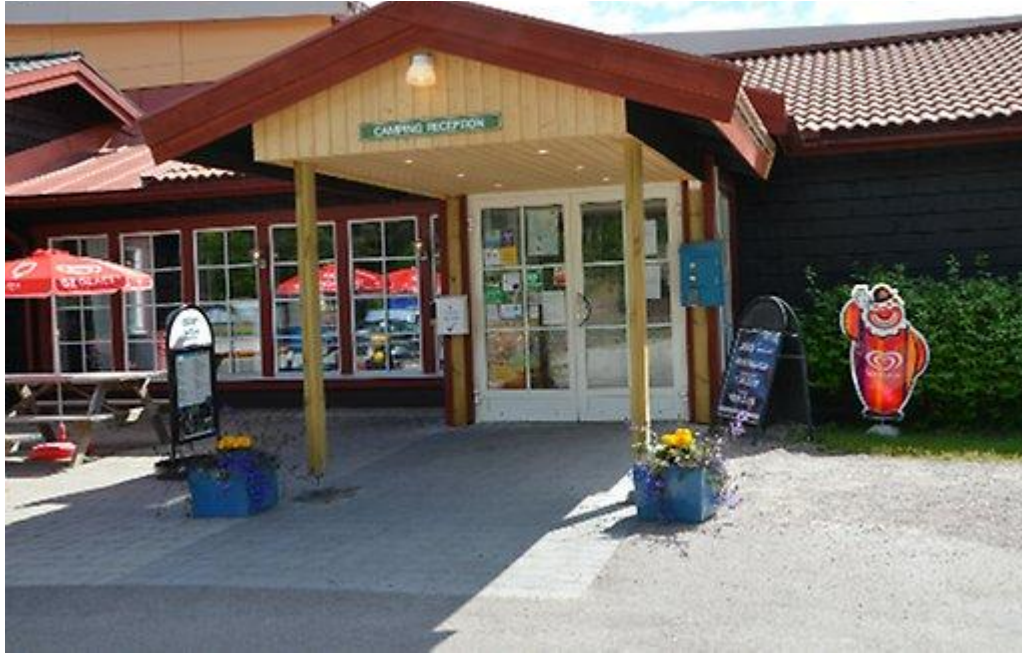
Rättviks Camping, Enåbadet entré.