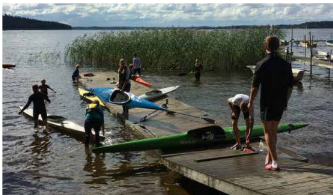
Årets klubbmästerskap bjöd på fint väder och fler deltagare än vanligt.

Årets klubbmästerskap avgjordes i fint väder och medvind sista söndagen i augusti. Bansträckningen gick längs med strandlinjen i Graneberg mot Flottsund med målgång förbi Alnäs. Vinden från sydväst avtog som tur var när starten närmade sig, men vågorna utgjorde fortsatt en utmaning för både ungdomar och seniorer. Årets tävling bjöd på fler deltagare än vanligt, särskilt bland de yngsta deltagarna. Sprintdistanserna 200 meter och 500 meter fick avgöras i tre separata heat, medan långloppet på 2500 och 5000 meter kördes med gemensam start. Traditionenligt avslutades allt med fika och varmkorvskalas. För resultat, se sidan 8.