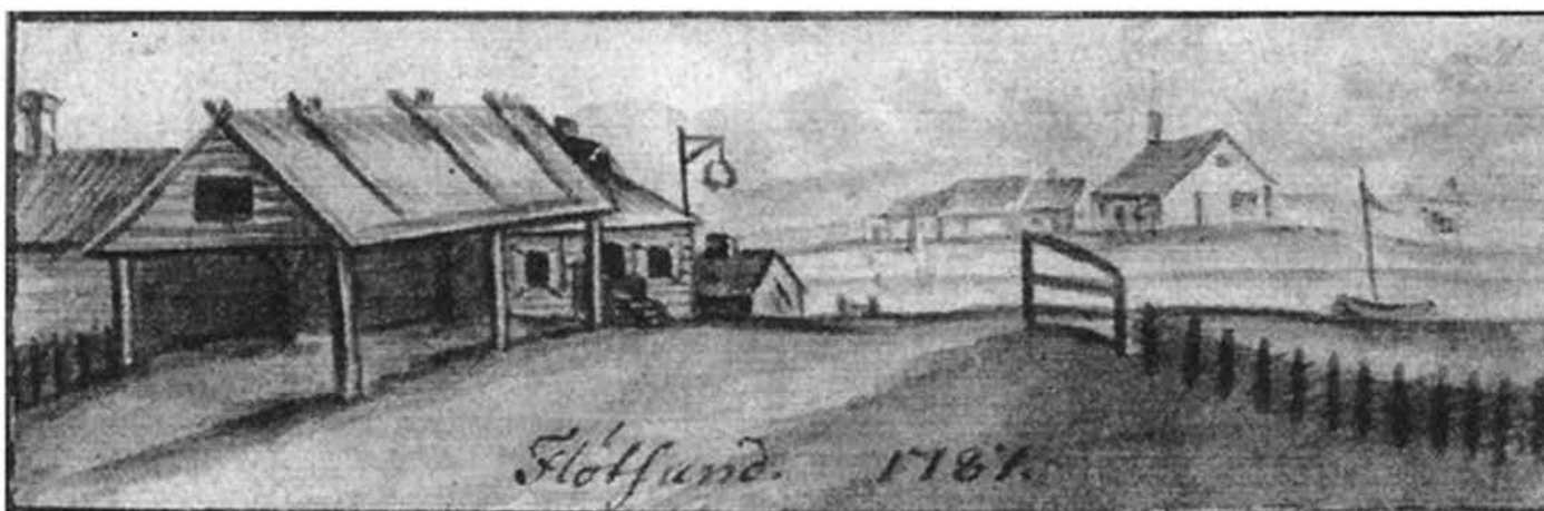
Målningen från 1787 visar bebyggelsen runt Flottsunds färjeläge från norr vid det gamla brofästet. Här syns färjkarlens stuga och hus på södra sidan. Längre upp från ån låg på både norra och södra sidan flera små krogar.

Ur Svenska Kryssarklubbens Uppsalakrets jubileumsbok 75 år. Stort tack till bokens redaktör Hans Norman för vänlig tillåtelse att använda artikeln.