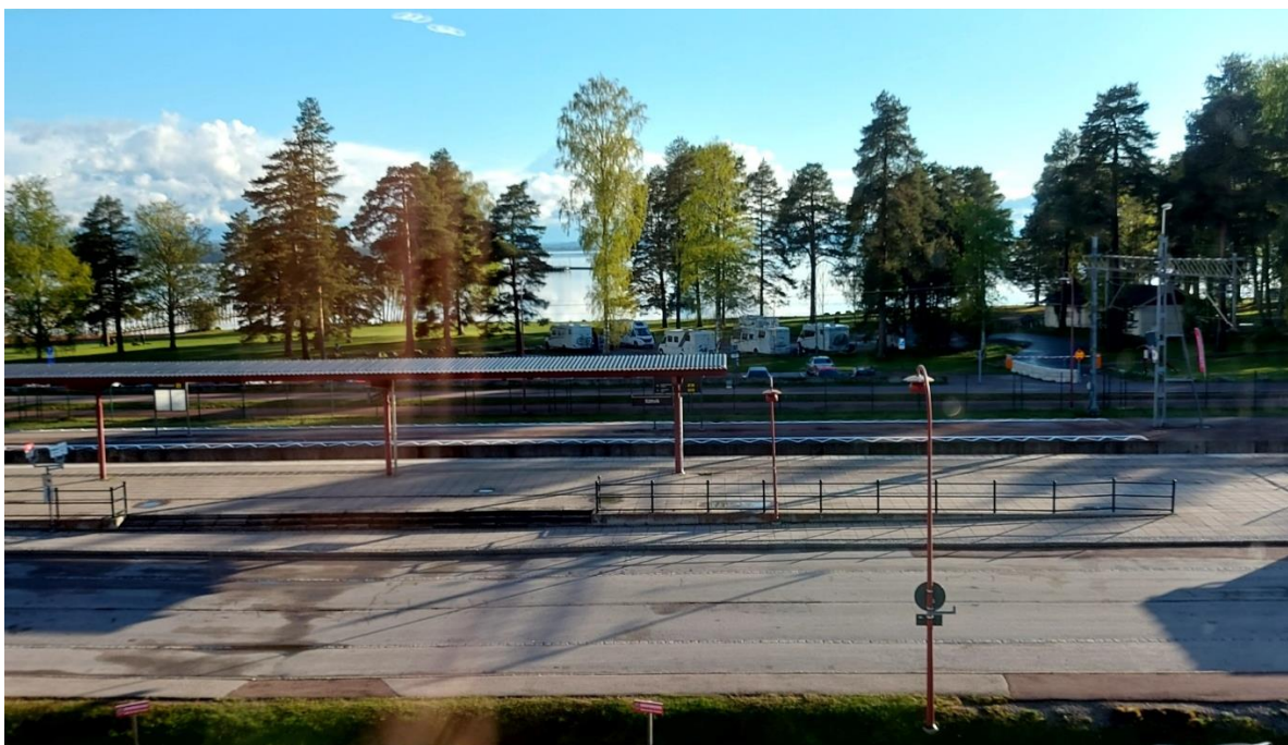
En kort stund senare såg det ut så här

För dem, som spelade slutspel på Storgatan blev det en fin kväll i alla fall till att börja med. Inga tog en bild från hotellrummet, där hon och Olle försökte få tillbaka lite värme i sina gamla frusna kroppar