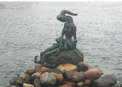
Kanske tar vi en titt på den alternativa Sjöjungfrun?

Efter frukosten lastar vi bussen och tar oss hemåt, antingen via bron eller via Helsingör och Helsingborg.