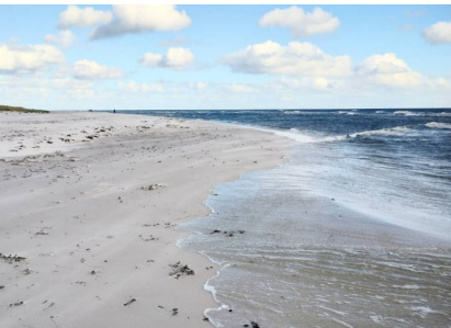
Orientering på Bornholms sydspets Dueodde är bäddat för fin terräng.

I samband med Höstlovet åker vi till Bornholm för deltagande i Bornholm Höst-Open, en 2-dagars orientering. Orientering i kustnära terräng med en del sanddyner, dag 2 på Bornholms sydligaste udde Dueodde. Efter orienterandet fortsätter vi direkt till Köpenhamn där vi turistar efter eget önskemål, 2 nätter stannar vi.