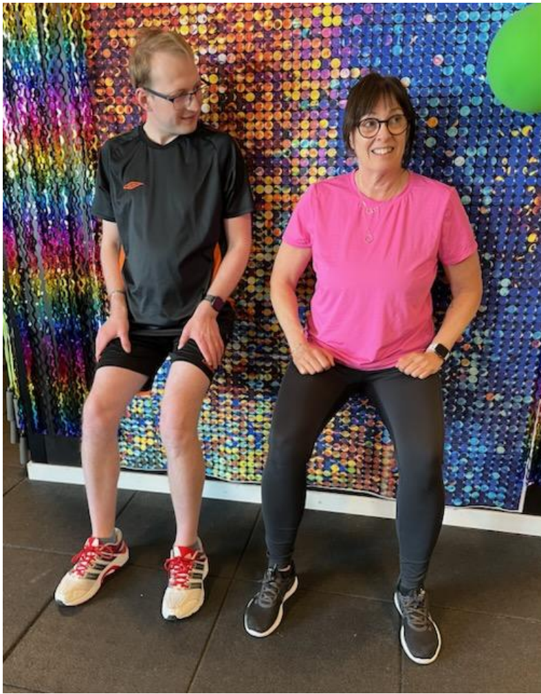
Lårmusklerna fick sig också en omgång