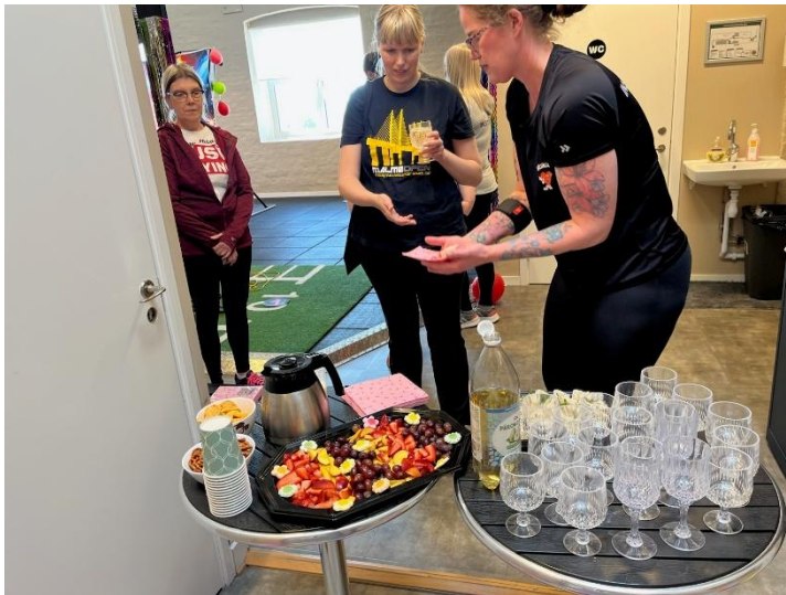
Gott med lite fika efter träningspasset